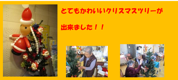
とてもかわいいクリスマスツリーが出来ました！！

ティアラでは認知症予防のため、学習療法を取り入れています。計算問題や数字のゲーム・短歌の書き取りなど、楽しみながら行っていただいています。特に一人で生活されている方を対象に生活関連動作の低下予防に繋がる事を期待して取り組んでいます。