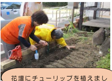
花壇にチューリップを植えました

今月は地域の運動会に参加しました。パン食い競争に挑戦しています。同じ町内会の方に交じって青空の下、楽しい一日となりました。また手作りの飯ではバランス良いメニューを一緒に考えています。